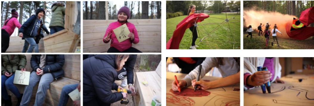
I arbetet med Redet av Ruben Wätte, 2020