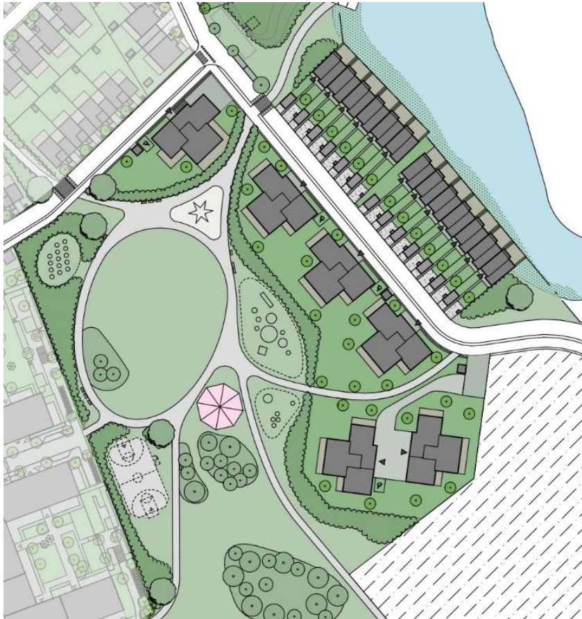
Detalj av parken från illustration över del av detaljplaneområdet, från detaljplanen (Österåkers kommun, 2021)