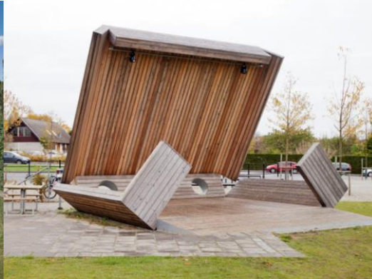
Pizzabox av Kristina Matosuch och Anders Soidre för Hagalundskolan, 2016