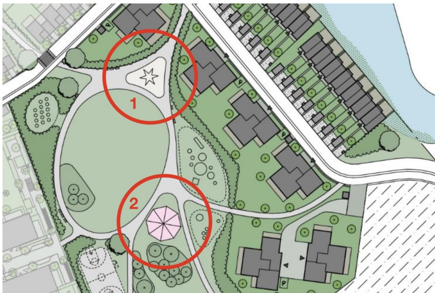
Detalj av parken från illustration över del av detaljplaneområdet, från detaljplanen (Österåkers kommun, 2021)