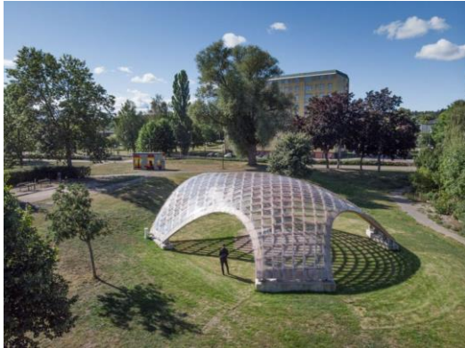
Paviljon av Map 13 Barcelona för Statens konstråd 2018