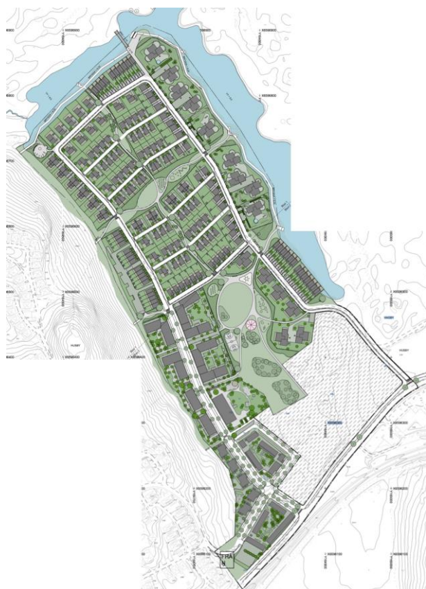
Illustration över del av detaljplanelområdet, från detaljplanen Österåkers kommun, 2021 (Två sammansatta illustrationer)

I framtiden kommer området erbjuda stora möjligheter till både rekreation och aktivitet, då området gränsar mot den nybyggda Multiarenan belägen vid Åkers Runö station, och golfbanan ska utvecklas för att kunna användas året runt, med exempelvis skidspår, rekreation och aktivitet inom området med parker, lekplatser, promenadvägar, utegym, bevarad kulturmiljö, platser för vila, utblickar och vattenkontakt.